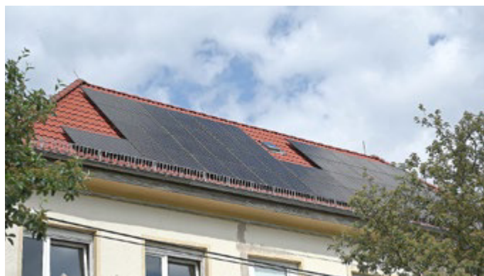
So sieht es auf dem Kita-Dach aus.

Bereits zuvor wurde die Kindertagesstätte in Rudisleben mit einer Photovoltaikanlage ausgestattet. Die Stadt Arnstadt setzt damit den Ausbau erneuerbarer Energien auf kommunalen Gebäuden Schritt für Schritt fort. Ziel ist es, Energiekosten zu reduzieren, CO 2 -Emissionen zu senken und die städtischen Einrichtungen zukunftsfähig aufzustellen.