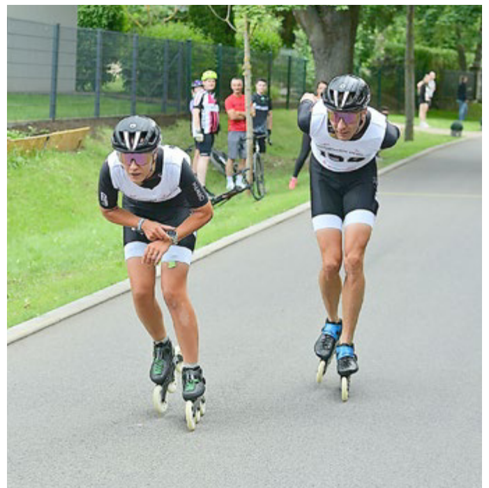
Fahrrad, Skiroller, Speedskater - die Jonastaler Challenge ist ein Multisport-Event

Ein großes Dankeschön gilt allen Helferinnen und Helfern, Vereinen, Sponsoren, Partnern sowie den zahlreichen Zuschauerinnen und Zuschauern entlang der Strecke.