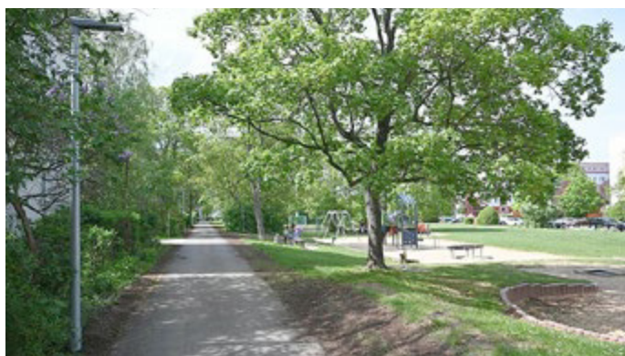
Der neue Weg hat nun auch Licht!

Gebaut wurde vom 27.10.2025 bis 19.12.2025 und dann - nach der Winterpause - ab 16.03.2026 bis 30.04.2026. Die Auftragssumme aller Auftraggeber zusammen betrug 129.417,72 € brutto.