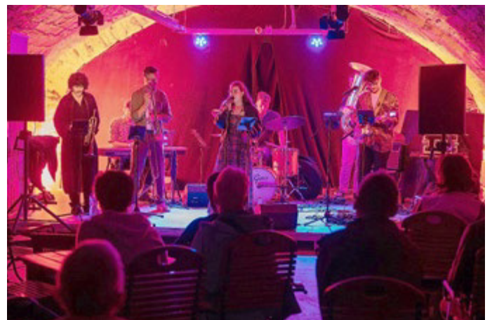
Die Nacht der Künste findet diesmal im Garten des Schlossmuseums statt. 2025 war sie im Prinzenhofkeller zu Gast.

Auch kulinarisch ist bestens für die Gäste gesorgt. Verschiedene Angebote mit Speisen und Getränken runden den Abend ab und machen die Nacht der Künste zu einem Fest für alle Sinne.