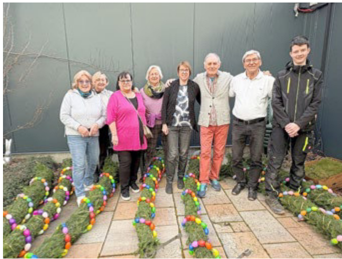
Fleißige Helferinnen und Helfer haben bei der Gärtnerei Leffler die Bogenelemente des Osterbrunnens geschmückt.