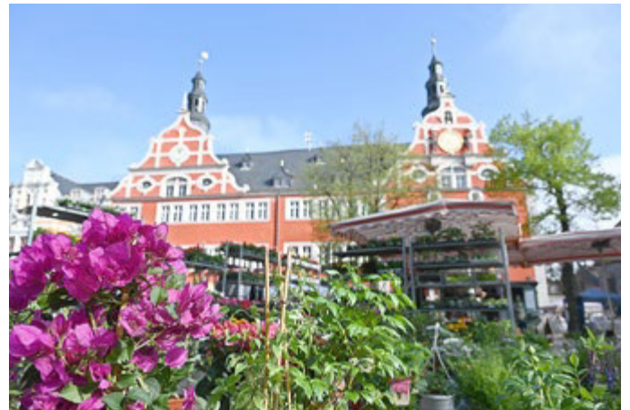
Am 25. April wird der Arnstädter Riedplatz zum Blütenmeer.

Ganz viele Veranstaltungen finden am Wochenende vom 25. und 26. April statt - etwa der 15. Wirtschaftsfrühling in der Stadthalle, der City-Lauf in der Innenstadt und der 5. Reklame-Treff in der Zimmerstraße. Außerdem feiert der Städteparnterschaftsverein sein 30-jähriges Bestehen. Die Marktmeister der Stadt Arnstadt laden am Samstag, 25. April, von 9 bis 15 Uhr zum Arnstädter Frühjahrs- und Pflanzenmarkt auf dem Riedplatz in Arnstadt ein. Passend zum Frühling bieten zahlreiche „grüne“ Händler Obst und Gemüse, Stauden, Gehölze und Kräuter an. Des Weiteren können Sie sich auf Blumen, Beeren sowie Beet- und Balkonpflanzen freuen. Nur einen Tag später, am Sonntag, 26. April, folgt der Autofrühling in der Innenstadt. Von 10 bis 17 Uhr werden Neuwagen und Oldtimer gezeigt, ein buntes Programm läuft auf der Showbühne, die Arnstädter Geschäfte bieten einen verkaufsoffenen Sonntag an.