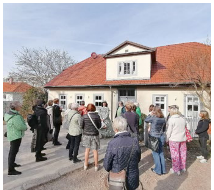
Großer Andrang herrschte bei den Marlitt-Stadtführungen.

Die hohe Beteiligung unterstreicht das große Interesse an Veranstaltungen rund um den Internationalen Frauentag und zeigt, wie wichtig Austausch, kulturelle Angebote und gemeinsames Erleben in der Stadtgesellschaft sind. Die Stadt Arnstadt dankt allen Beteiligten sowie den zahlreichen Besucherinnen und Besuchern für diesen sehr gelungenen Tag.