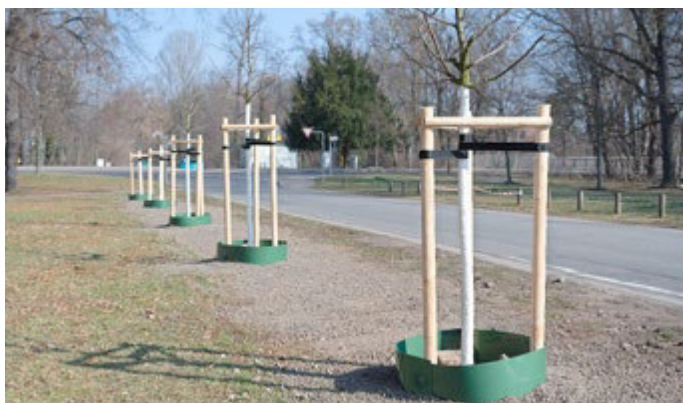
Vielfalt an der Hammerecke: Sieben neue Bäume - darunter eine Silber-Linde, Szeleste, Kupfer-Felsenbirnen und verschiedene Kultur-Birnen - ergänzen die Bepflanzung.

Die Ausführung übernimmt die Firma Landschaftsbau Montag GmbH & Co. KG aus Erfurt. Die Auftragssumme einschließlich dreijähriger Fertigstellungs- und Entwicklungspflege beträgt 127.479,40 Euro. Planung und Ausschreibung erfolgten über die Stadtverwaltung Arnstadt, Abteilung Grün, Friedhöfe und Forst.