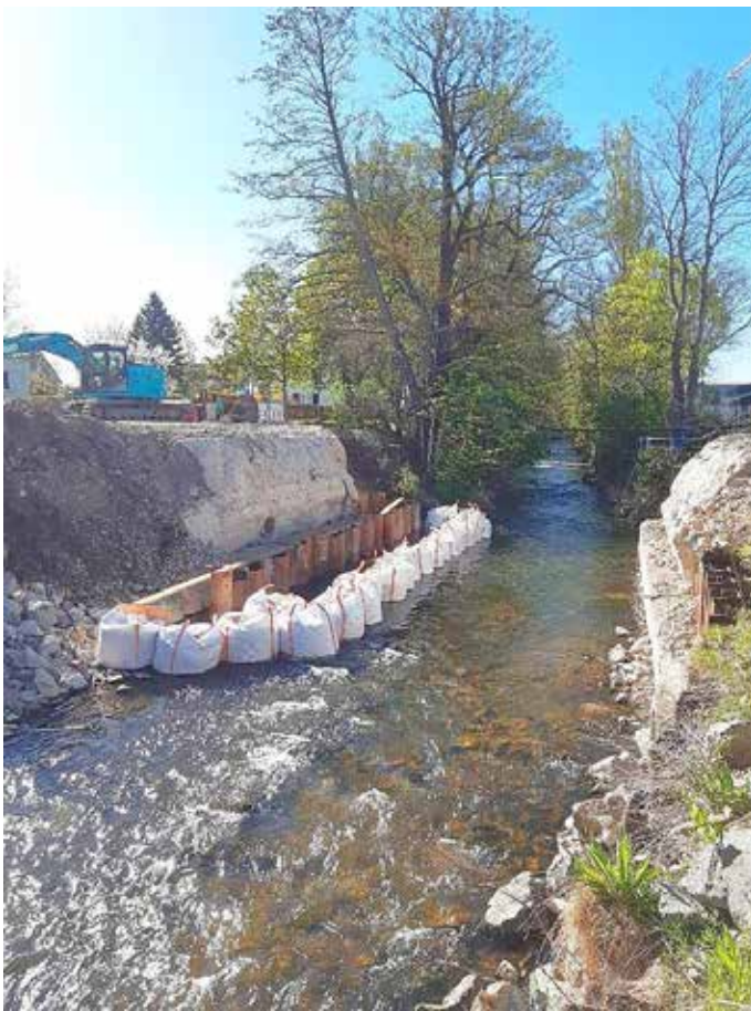
Blick auf die Sandsäcke und montierten Spundbohlen

Die Arbeiten an der Bierwegbrücke schreiten planmäßig voran. Im April begann die Baufirma damit, große Sandsäcke zu platzieren, um den Flussstrom der Gera zu kontrollieren. Anschließend wurden die ersten Spundbohlen erfolgreich in den Boden gerammt und abgedichtet. Diese Maßnahme dient dazu, die alten Überreste des massiven Brückenunterbaus, auch bekannt als Widerlager, trocken zu legen, um sie für die weiteren Arbeiten vorzubereiten. Zusätzlich fungieren die Spundwände als Barrieren, die den Flusslauf von der alten Brückenkonstruktion trennen. Diese Vorkehrung ist nicht nur für den Abbruch des Widerlagers von Bedeutung, sondern auch für den anschließenden Neubau.