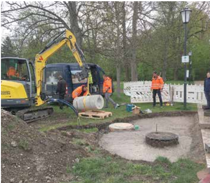
Die Arbeiten am Trinkbrunnen gehen voran

Am 19. April 2024 wurden am Theaterplatz die Arbeiten zur Installation eines Trinkbrunnens aufgenommen. Dieser Trinkbrunnen aus Kohlplatter Kalkstein wird von der Baufirma Eurovia Verkehrsbau GmbH aus Umferstedt in Zusammenarbeit mit der Brunnenmeisterei Schreier GmbH aus Buttstedt errichtet.